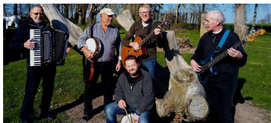
Spilopperne står for underholdningen.