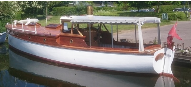
Ladye Dora besøger Femø havn på turismens dag 2019.

Vi byder velkommen til alle og ønsker jer en dejlig dag.