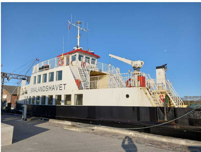
Den nye afløser færge "Smålandshavet" ligger til i Femø havn.

Tag en tur med Lolland Færges nyindkøbte afløserfærge. Afgang Kragenæs kl. 10.00 og kl. 12.00, afgang Femø kl. 11.00 og kl. 16.00. M/F Smålandshavet medtager kun gående og cyklister. Det er også gratis for passagerer og cykler at sejle med Smålandshavet denne dag. Der skal ikke bookes til overfarten. Mens Smålandshavet ligger på Femø, er alle velkomne til at gå om bord og se færgen an.