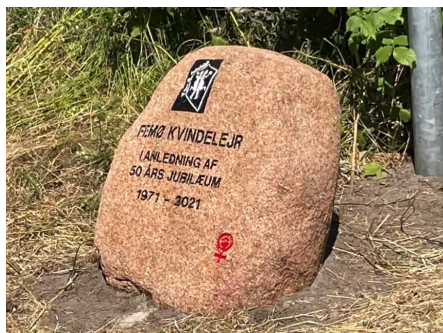
Jubilæumssten for kvindelejren