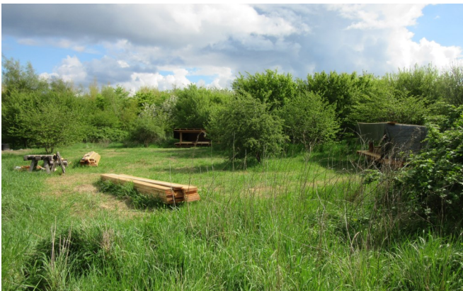
Nye shelters ved sommerhusudstyknigen bliver afsløret.

Igen i år spenderer regeringens sommerpakke gratis færgefart for cyklister og gående og handicappiler, så man kan godt sige, at det er Turistens dag hver dag, men lige præcis på Turismens dag, lørdag d. 3. juli, viser Femø sig frem fra sin bedste side. Gå ind på lollandfaergefart.dk og book en færgebillet, så du er sikker på at kunne komme med, uanset om du er gående, cyklist eller evt. i bil. Tag venner og familie med på en dagstur til TURISMENS DAG på Femø og smag på det skønne øliv. Vi byder jer velkommen med et smil og åbner dørene på vid gab med forskellige aktiviteter, musik, kunst, mad og drikke og dejlig sommerstemning.